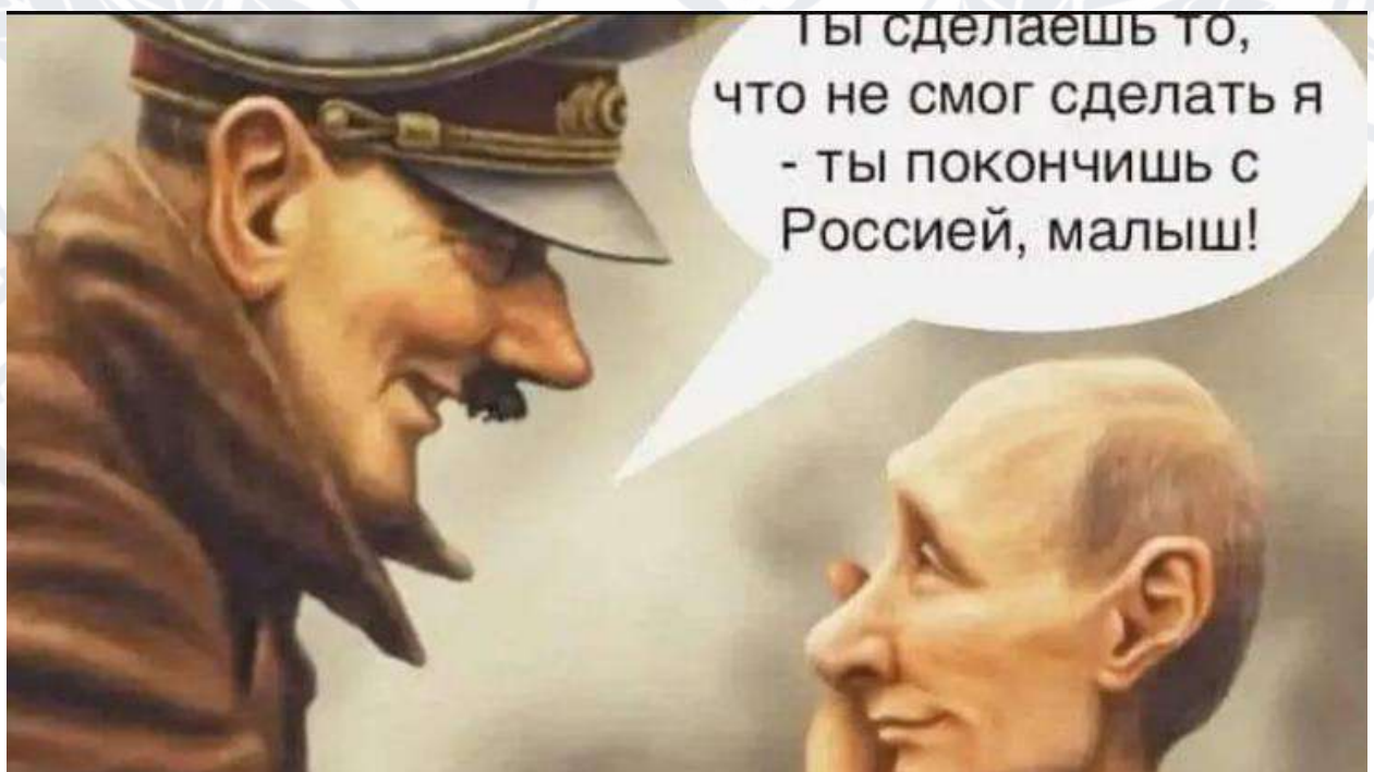
Рис. 2.14. Мем про володимира путіна та Адольфа Гітлера

Картина повністю помінялась після повномасштабного російського вторгнення. За результатами соціологічного опитування, яке проводилося соціологічною службою Центру Разумкова спільно з Фондом «Демократичні ініціативи» ім. І. Кучеріва навесні 2023 року: безпрецедентна кількість українців, а саме – 94% респондентів погоджуються з думкою, що путін – це Гітлер 21 сторіччя [19]. Таке нове сприйняття лідера ворожої країни не могло не знайти відгук в мемах (Рис. 2.14).