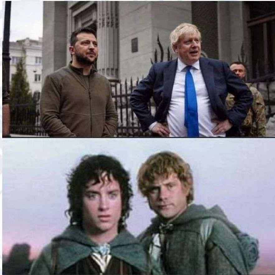
Рис. 2.1. Мем про Володимира Зеленського та Бориса Джонсона в образах героїв фільму «Володар перснів»

Візьмемо до розгляду перший запропонований інтернет-мем (Рис. 2.1), об'єктом якого стає Борис Джонсон.