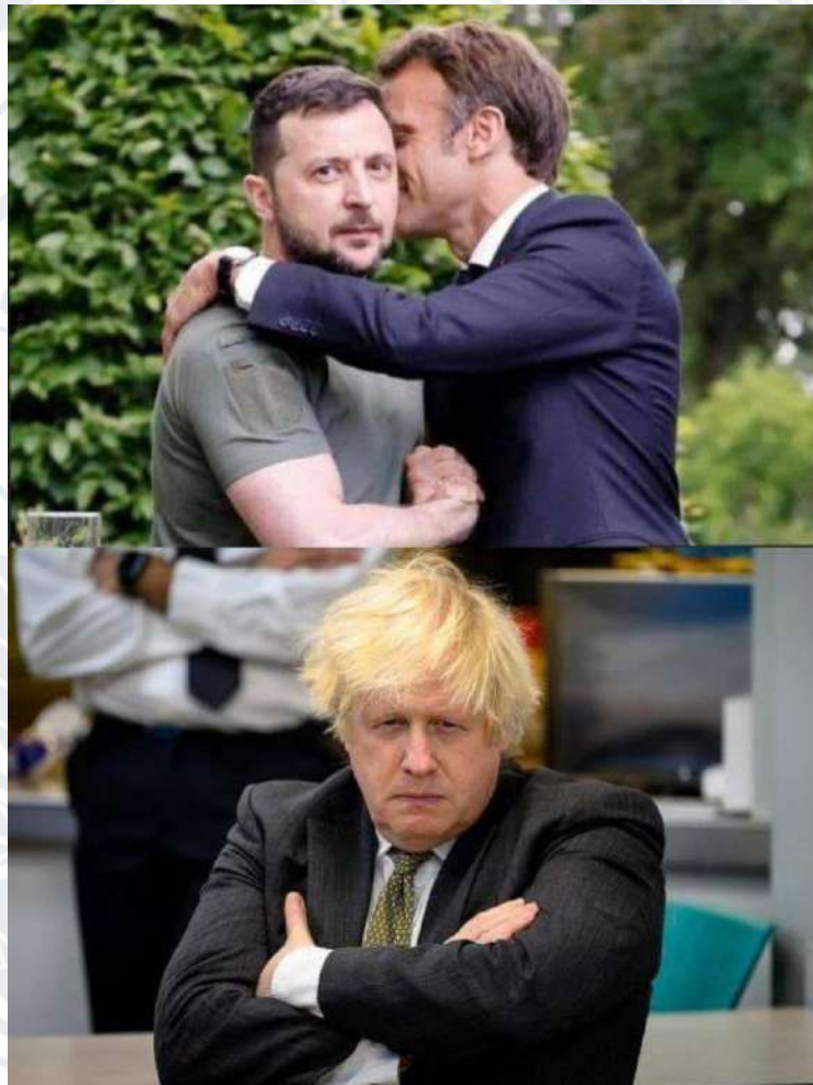
Рис.2.3. Мем про «ревнивого» Бориса Джонсона

Цей мем (Рис. 2.3) з'явився після після того, як у Києві побували канцлер Німеччини Олаф Шольц, президент Франції Емануель Макрон і