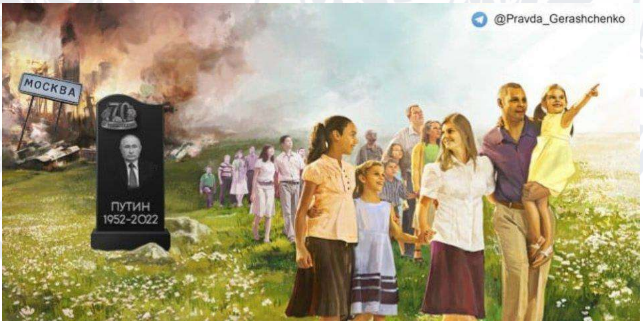
Рис. 2.17. Мем про світле майбутнє українців

Цей інтернет-мем був (Рис. 2.17) приурочений до семидесятирічного ювілею президента російської федерації володимира путіна та відображає, по суті, уявлення про світле майбутнє більшості українців та українок – смерть головного ворога та руйнацію столиці ворожої держави.