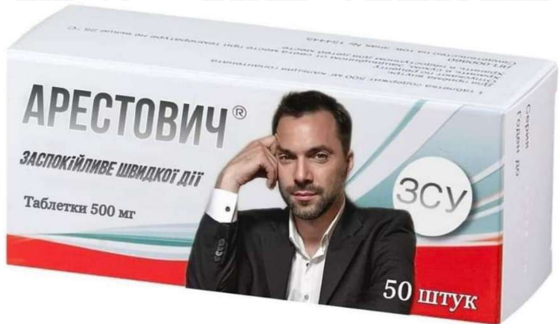
Рис. 2.23. Мем про Арестовича та заспокійливе

Першими політичними акторами, які почали з'являтися в якості об'єктів інтернет-мемів, були тодішній радник Офісу Президента Олексій Арестович та очільник Миколаївської ОВА Віталій Кім. Перший став популярним героєм мемів через брифінги щодо поточної ситуації на фронті на початку повномасштабного вторгнення. На цих брифінгах Арестович виконував функцію заспокійливого для суспільства.