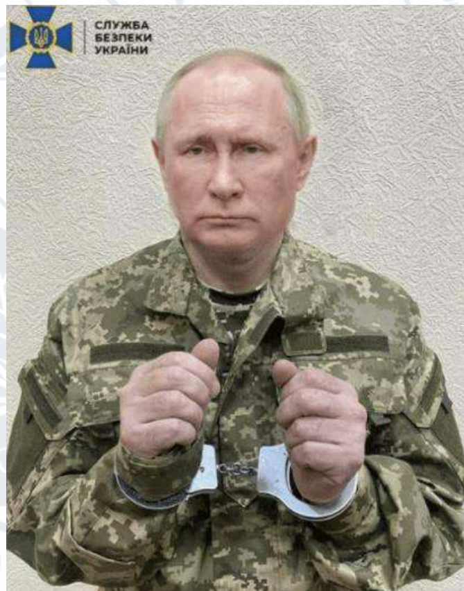
Рис. 2.16. Мем про володимира путіна в образі Віктора Медведчука