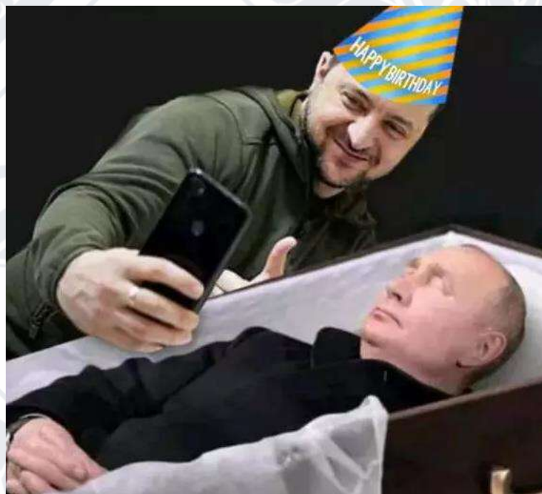
Рис. 2.20. Мем про привітання путіна з днем народження від Володимира Зеленського

Наступний інтернет-мем (Рис. 2.20) так само був приурочений до семидесятирічного ювілею президента російської федерації володимира путіна.