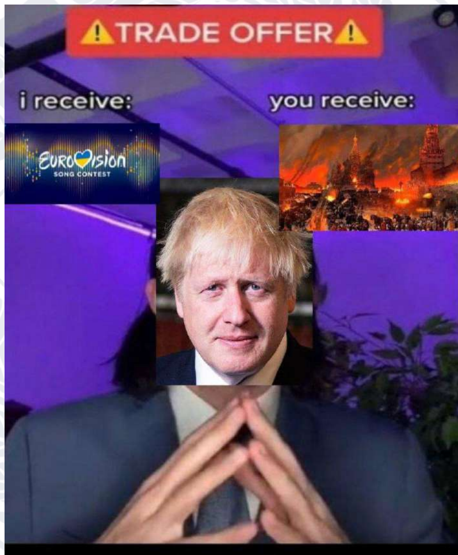
Рис. 2.5. Мем про Бориса Джонсона за шаблоном «trade offer»

Наступний мем (Рис. 2.5) виник після того, як Європейська мовна спілка та BBC підтвердили, що Пісенний конкурс Євробачення-2023 проведуть у Великій Британії від імені України. Цей мем побудований на