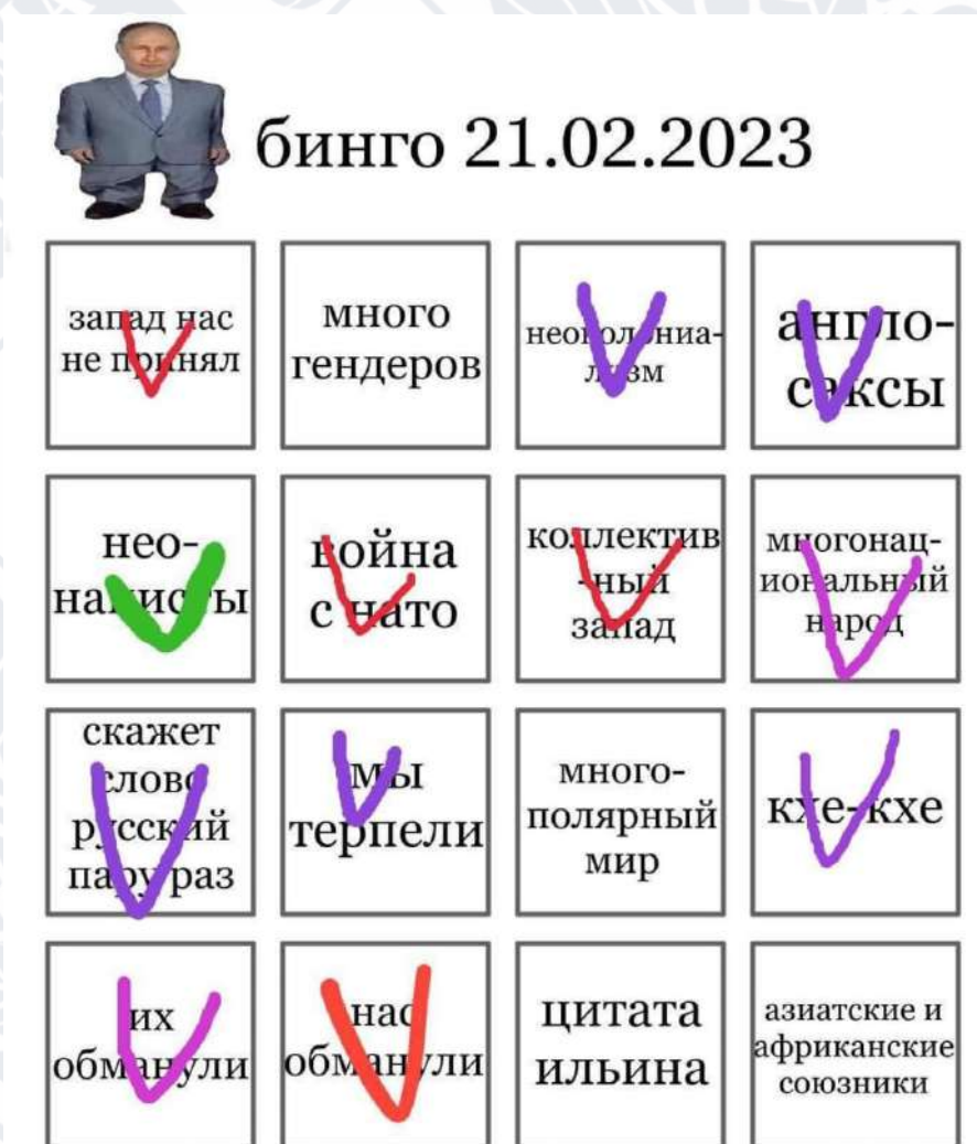
Рис. 2.19. Мем про путіна та гру Бінго

Спонсор: лідери Білорусі, Казахстану та Вірменії.