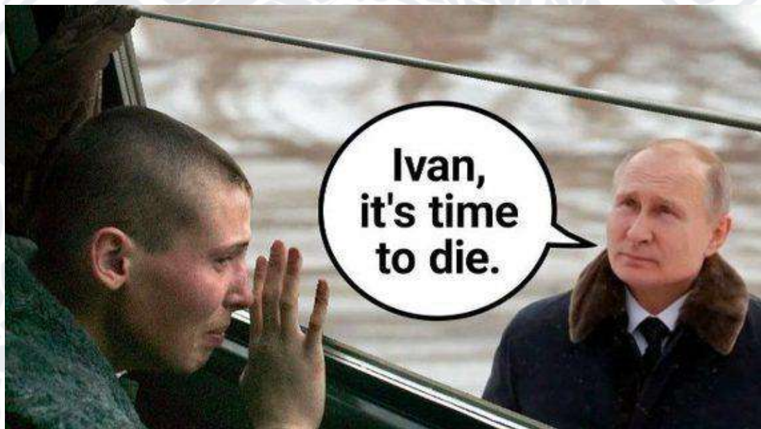
Рис. 2.15. Мем «Іване, час померати»

В українських інтернет-мемах путін зображається ворогом не лише українського народу, а й російського. Цей мем (Рис. 2.15) належить до категорії мемів про «могілізацію». Їх почали робити на основі звернення володимира путіна до російського народу про початок часткової мобілізації. Указ був підписаний в той же день, як вийшла новина, тобто, 21 вересня 2022 року. У зверненні повідомлялось, що призову на військову службу підлягатимуть лише громадяни, які перебувають у запасі, проходили службу в лавах збройних сил рф та інших. Проте ця ситуація викликала обурення у російського народу, а для українців стала підґрунтям для створення нових мемів [18].