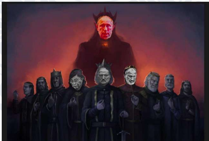
Рис.2.18. Мем про путіна в образі Саурона

В цьому мемі путіна порівняли з антагоністом відомої трилогії Толкіна «Володар перснів» – повелителем темряви Сауроном, який роздав дев’ять перснів правителям дев’яти королівств, після чого ті стали його рабами.