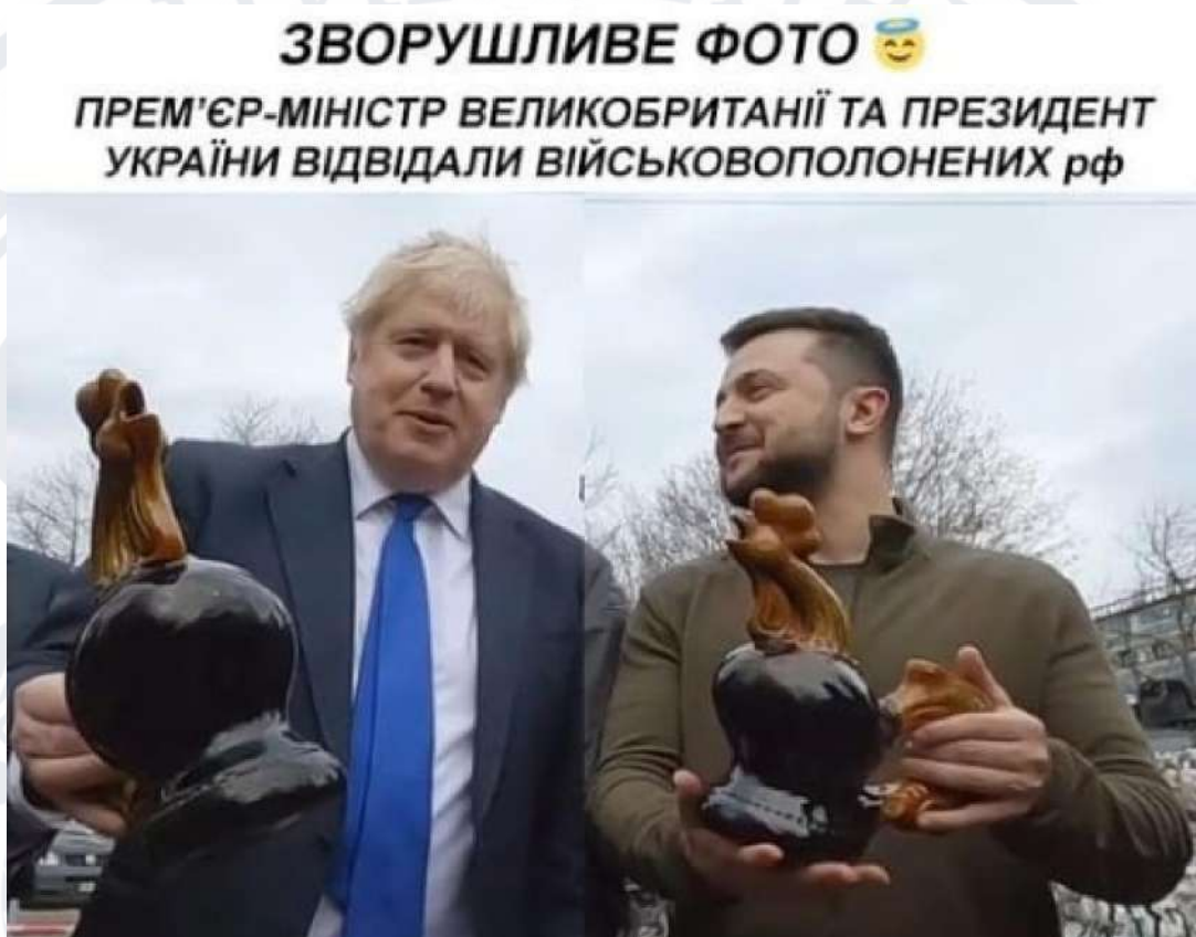
Рис. 2.2. Мем про Бориса Джонсона та Володимира Зеленського з керамічними півниками

Спонсор: Президент України Володимир Зеленський.