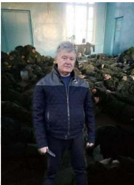
Рис. 2.21. Мем про Петра Порошенка та мертвих російських солдатів

В той час будь-яка героїчна дія з боку українських захисників або цивільних, направлена на протистояння ворогу, ставала приводом для інтернет-мемів для підняття бойового духу усього населення. Можна пригадати меми про ромів, які на тракторі вкрали ворожий танк або про жінку, яка збила ворожий дрон банкою з огірками.