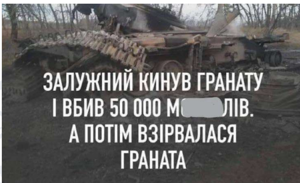
Рис. 2.11. Мем про Валерія Залужного та гранату