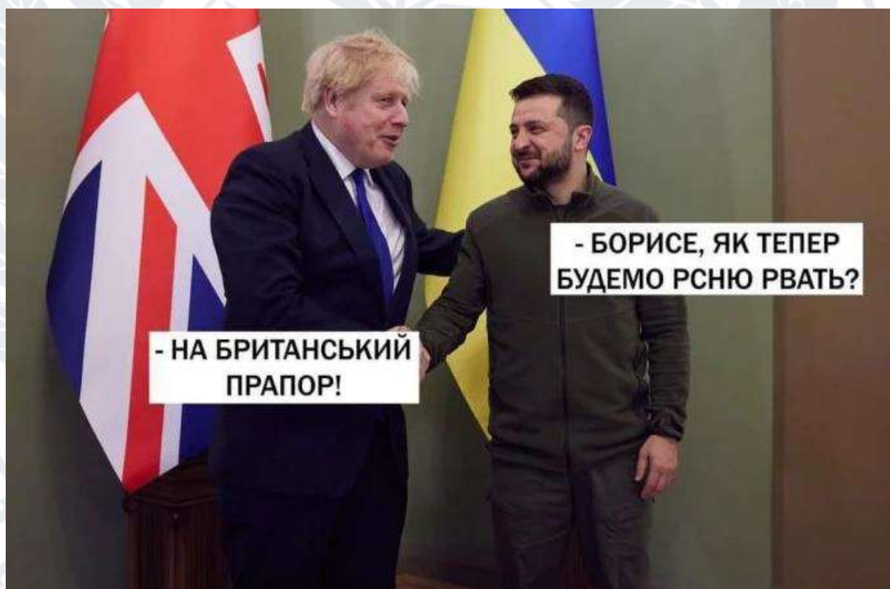
Рис. 2.4. Мем про Бориса Джонсона, Володимира Зеленського та британський прапор

Ще один інтернет-мем (Рис. 2.4), об'єктами якого одночасно стають Прем'єр-міністр Великої Британії Борис Джонсон та Президент України Володимир Зеленський, які разом планують стратегію перемоги над ворогом.