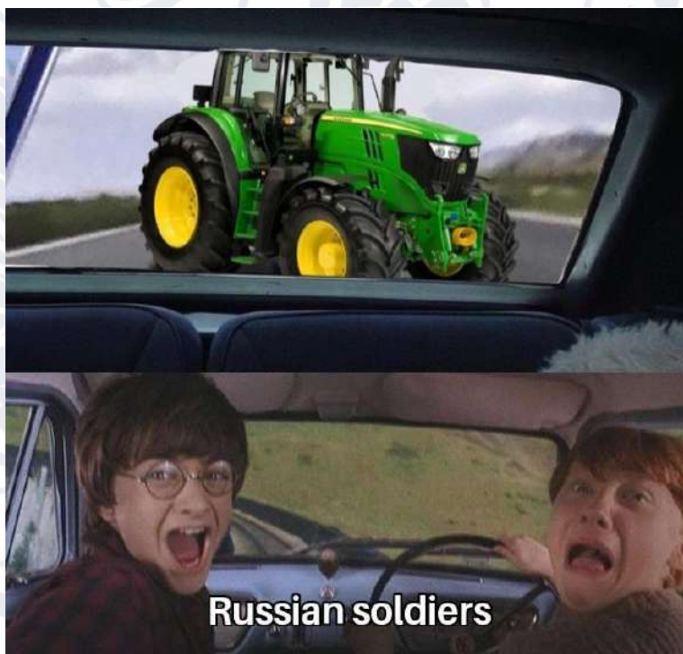
Рис. 2.22. Мем про російських солдатів та український трактор

В той час будь-яка героїчна дія з боку українських захисників або цивільних, направлена на протистояння ворогу, ставала приводом для інтернет-мемів для підняття бойового духу усього населення. Можна пригадати меми про ромів, які на тракторі вкрали ворожий танк або про жінку, яка збила ворожий дрон банкою з огірками.