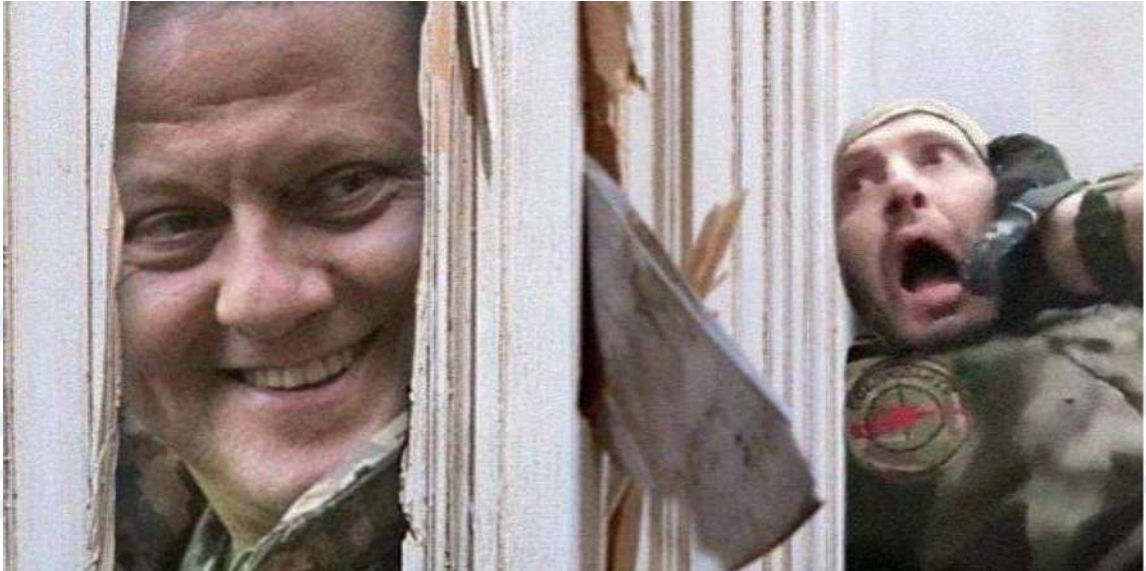
Рис. 2.7. Мем про Валерія Залужного в образі героя фільму «Сяйво»

Цей мем (Рис. 2.7) є відсилкою на фільм на психологічний трилер Стенлі Кубріка під назвою «Сяйво». В епізоді фільму, наведеного в мемі, герой американського актора Джека Ніколсона прорубує сокирою двері, намагаючись дістатися до своєї жертви. Так само і Валерій Залужний в цьому мемі полює на російського окупанта, який вторгнувся на територію України та є цілком законною ціллю для ліквідації.