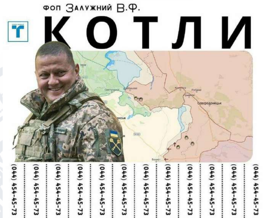
Рис. 2.8. Мем про Валерія Залужного в образі майстра з ремонту котлів

В цьому мемі (Рис. 2.8) Головнокомандувача Збройних Сил України зобразили як майстра з ремонту котлів. «Котлами» у військовому жаргоні часто називають оточення ворожих угруповань. Цей мем з'явився після того, як Збройні Сили України під Балаклесю взяли в таке саме оточення бійців загонів спецпризначення СОБР з Самарської області та Башкортостану, що в РФ.