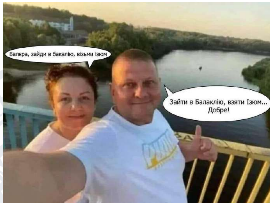
Рис. 2.9. Мем про Валерія Залужного та його дружину

Наступний мем (Рис. 2.9) став доволі популярним, а з'явився він після успішного контрнаступу Збройних Сил України восени 2022 року. В основі жарту лежить те, що Валерій Залужний неправильно почув свою дружину Олену та замість того, щоб зайти в бакалійний відділ магазину та взяти засушений віно град звільнив українські міста Балаклія та Ізіюм.