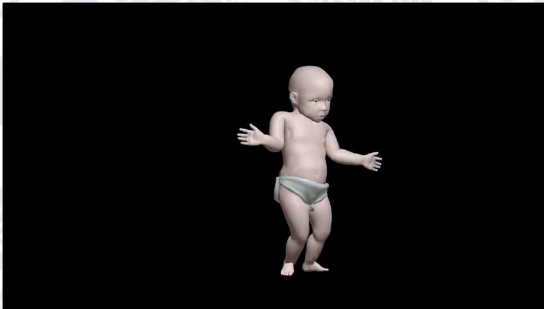
Рис. 1.2. Скріншот Танцюючої дитини

Першим цифровим мемом прийнято вважати «Танцюючу дитину», який також мав назву «Бейбі ча-ча», в оригіналі «Dancing baby» або «Baby cha-cha» (Рис.1.2). Детально історію цього мему описав Метью Міраполь у статті для The New York Times у 1997 році [4]. Бейбі ча-ча – це 3D анімація танцюючого немовляти, яку вперше опублікували у 1996 році через електронну пошту.