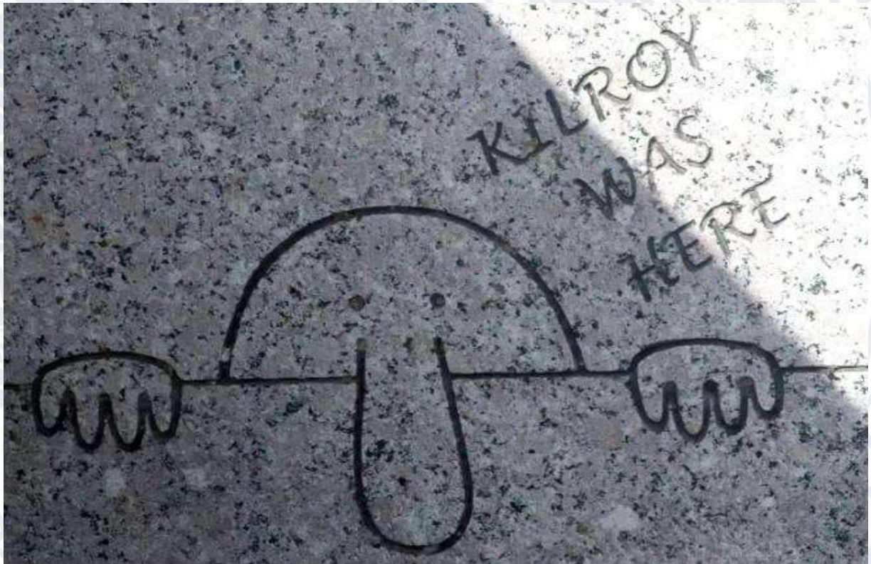
Рис.1.1. Меморіал Другої світової війни у Вашингтоні, округ Колумбія

Щодо походження назви «Кілрой», то це є предметом суперечок. Деякі історики вказують на Джеймса Дж. Кілроя, інспектора верфі Фор-Рівер у Брейнтрі, Массачусетс, який нібито написав «Кілрой був тут» на різних частинах кораблів під час їх будівництва (після того, як кораблі були завершені, ці написи мали б бути недоступними, звідси репутація «Кілроя» як людини, яка потрапляє у важкодоступні місця). Іншим кандидатом є Френсіс Дж. Кілрой-молодший, солдат із Флориди, хворий на грип, який написав на стіні своєї казарми «Кілрой буде тут наступного тижня». Про це писав Боб Штраус у статті для довідкового сайту ThoughtCo [8] у 2020 році.