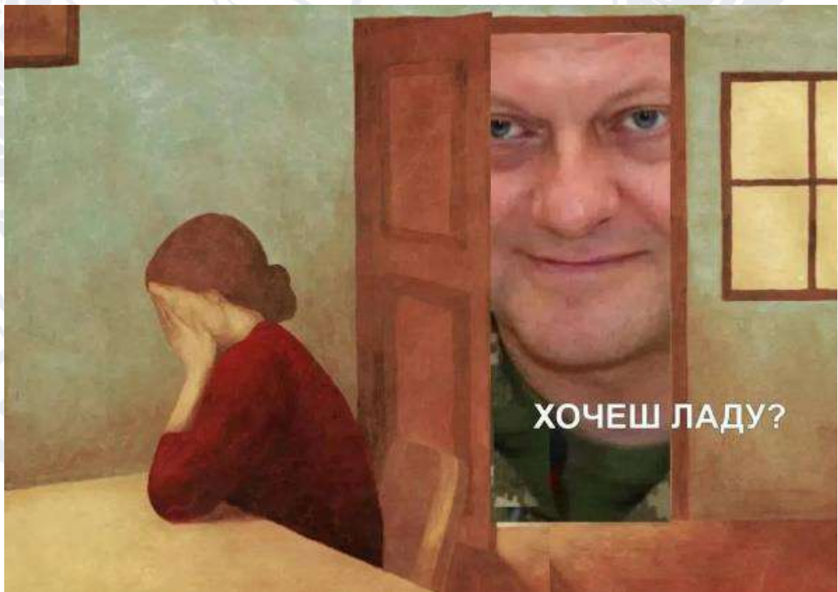
Рис. 2.13. Мем про Валерія Залужного та Ладу