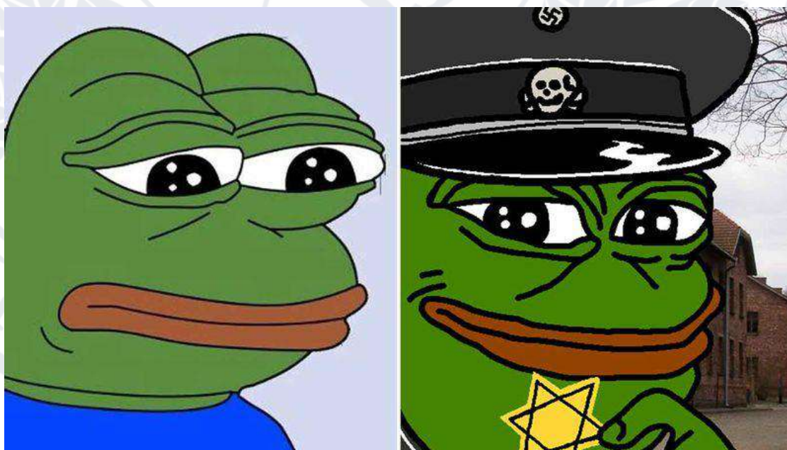
Рис. 1.4. Приклад мему «рере»

По суті, в цей період було два паралельних напрямку зламу мему. Перший, це його переосмислення, де тогочасний мем «рере» (Рис. 1.4) міг трактуватися як проста сумна жаба, або ж символ ненависті [4].