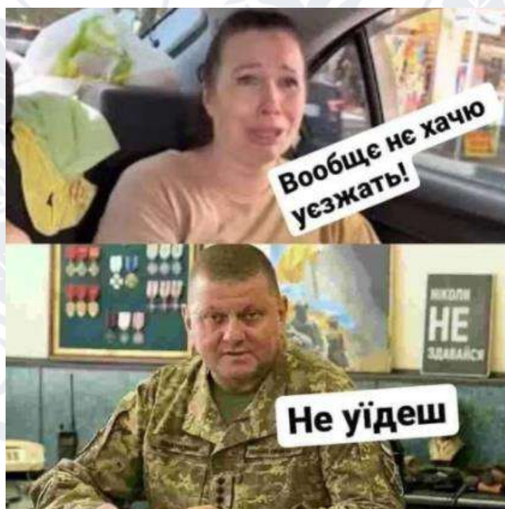
Рис. 2.12. Мем про Валерія Залужного та ниючу росіянку