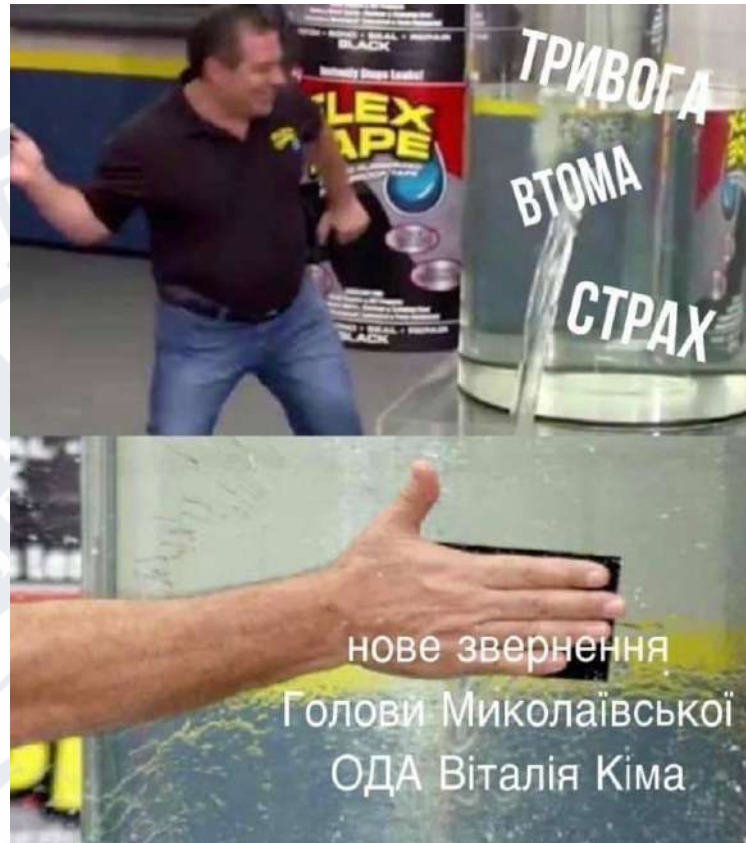
Рис. 2.24. Мем про Віталія Кіма

Загалом, інтернет-меми початку повномасштабного російського вторгнення несли функцію підняття бойового духу населення в часи цілковитої невизначеності та страху перед ворогом, який в ті часи ще остаточно не втратив свій образ «другої армії світу». В контексті інформаційної війни ці меми несли скоріш оборонний характер.