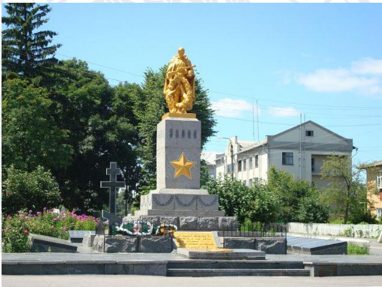
Рис. 1. Братська могила 30 членів Вінницької більшовицької організації і 432 радянських воїнів, загиблих при звільненні міста та навколишніх сіл, м. Калинівка