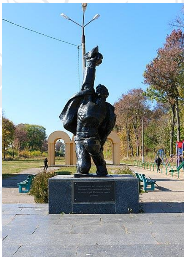
Рис. 5. Пам'ятник партизанам, м. Калинівка