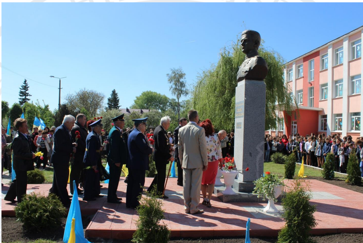
Рис. 7. Відкриття пам'ятника Герою Радянського Союзу М.Ф. Степовому на території Калинівської ЗОШ 1-3 ступеня №1