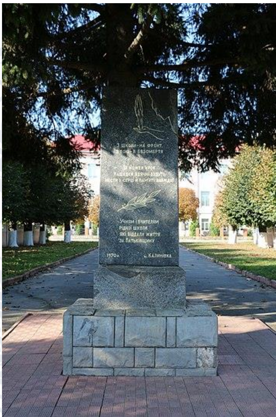
Рис. 6. Пам'ятник вчителям і учням, ЗСО №3 м. Калинівка