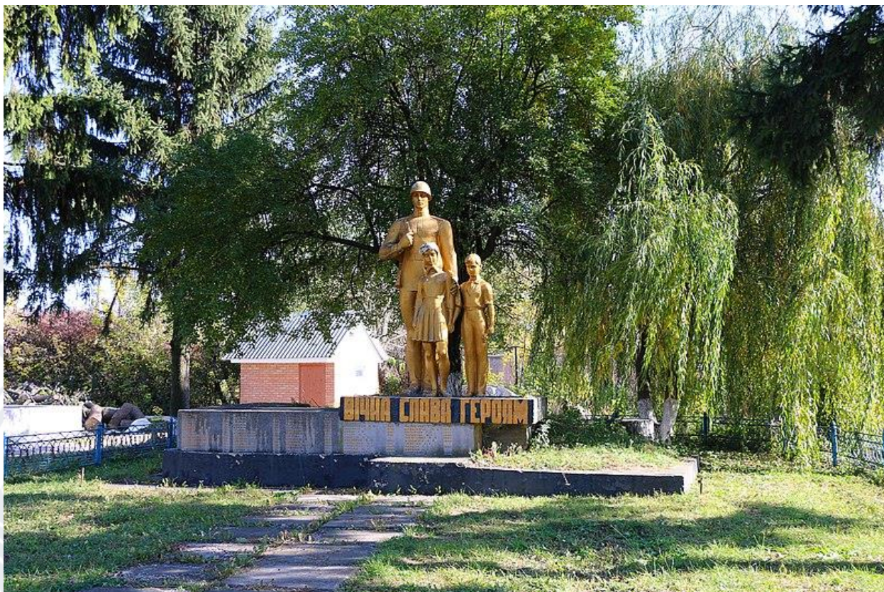
Рис. 4. Пам'ятник 98 воїнам-землякам, м. Калинівка